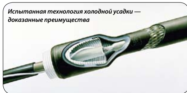
Испытанная технология холодной усадки — доказанные преимущества

Технология холодной усадки также является изобретением специалистов компании 3М. В 1968 году, используя наши ноу-хау в производстве и преимуществе технологии холодной усадки, мы первыми в мире изготовили новаторские изделия, отличающиеся исключительными электрическими и механическими характеристиками, а также высокой эластичностью и длительным сроком службы. Технология холодной усадки нашла широкое применение в таких изделиях, как изолирующие трубки, соединительные муфты, переходные муфты и концевая заделка кабеля. Более чем 25-летний опыт работы и свыше 10 миллионов соединительных и концевых муфт 3М™, установленных по всему миру