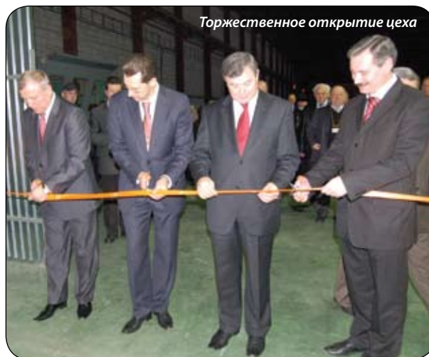
Торжественное открытие цеха