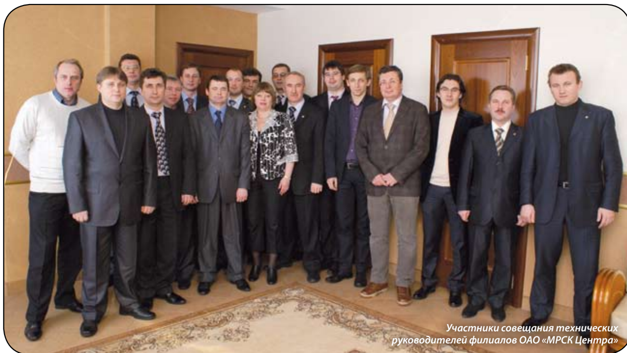
Участники совещания технических руководителей филиалов ОАО «МРСК Центра»

экономическая политика компании направлена на снижение издержек.