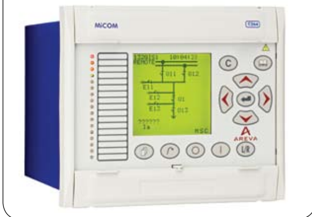
Контроллер присоединения MiCOM C264

Компания AREVA T&D предлагает заказчикам масштабируемые решения, которые включают: полный спектр терминалов РЗА серии MiCOM, систему автоматизации подстанций 6-750 кВ PACIS, системы диспетчеризации e-terracontrol, системы управления рынками e-terraplatform. Помимо этого мы можем предложить нашим заказчикам готовые решения по созданию системы управления электроснабжением предприятием (АСУЭ) и решение по управлению мощностью (PMS). По всем предлагаемым решениям компания AREVA T&D выполняет полный комплекс инженеринговых работ: конфигурирование, пуско-наладочные работы, сдача в опытную эксплуатацию, обучение и гарантийное/постгарантийное сопровождение. К настоящему моменту в Российской Федерации эксплуатируется более 30 000 терминалов РЗА серии MiCOM, в промышленной и опытной эксплуатации и в стадии реализации находятся более 100 проектов по автоматизации объектов