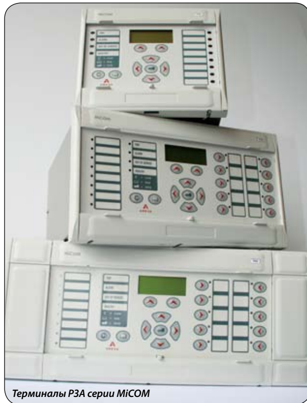
Терминалы РЗА серии MiCOM

Основным направлением деятельности компании AREVA T&D является поставка первичного электрооборудования, распределительных устройств на уровни напряже-