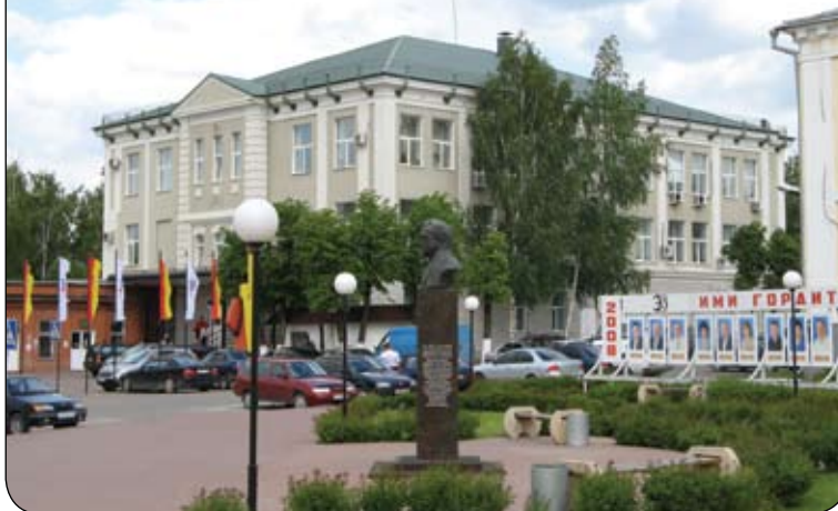
Площадь им. А.Г. Кольчугина. Здание заводоуправления

поддерживать денежные потоки, высокие объемы и достаточные ресурсы для развития.