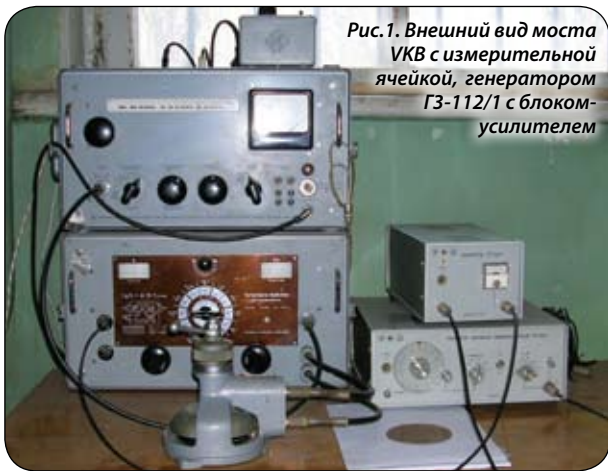
Рис.1. Внешний вид моста VKB с измерительной ячейкой, генератором ГЗ-112/1 с блоком-усилителем

Практическая формула для расчета угла диэлектрических потерь имеет вид \text{tg}\delta = A \cdot B \cdot f [кГц], где A и B — показания на шкалах прибора.