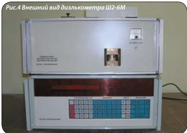
Рис.4 Внешний вид диэлькометра Ш2-6М

программ, обеспечивающих самодиагностику и юстировку приборов.