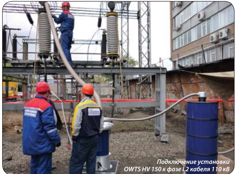
Подключение установки OWTS HV 150 к фазе L2 кабеля 110 кВ

Наша же установка OWTS HV 150 помещается в микроавтобус «Фольксваген Крафтер», а еще кроме установки в машине есть отсек для персонала, где можно поработать с документами или просто посидеть и отдохнуть. Это — совершенно другой уровень техники. Кроме того, эта установка по сравнению с резонансной дает неинтегральную оценку состояния кабеля, а позволяет определить на каком расстоянии от места подключения существует слабое место. Соответственно необходимо обратить внимание на этот участок, определить, что там. Если в этом месте установлена муфта, значит она плохо смонтирована. Или же муфта состарилась — ее надо менять. А может быть — повреждение оболочки кабеля и т.д. Все эти нюансы фиксирует установка OWTS HV 150.