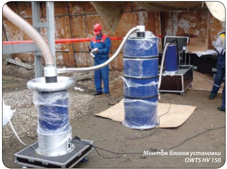
Монтаж блоков установки OWTS HV 150

Василий Кольцов: Совершенно верно. И очень отрадно, что в этом вопросе мы нашли соратников в лице руководителей ОАО «МРСК Волги» и ОАО «МОЭСК», которые понимают, что вопрос диагностики и даже испытания кабеля из сшитого полиэтилена — это вопрос очень важный и ответственный. Кроме нашего оборудования другой приемлемой альтернативы просто не существует. Хотя всем, в принципе, известно о существовании так называемых резонансных высоковольтных установок. Они создают испытательное напряжение промышленной частоты, но для испытания протяженных кабелей требуется очень большая мощность, чтобы на данной частоте зарядить кабель. Поэтому такую резонансную установку, рассчитанную на напряжение 150-250 кВ, в связи со своими значительными размерами и массой можно перевозить только на большом трейлере, что в городских условиях крайне неудобно, монтаж/демонтаж установки занимает много времени, да и стоят они в несколько раз дороже.